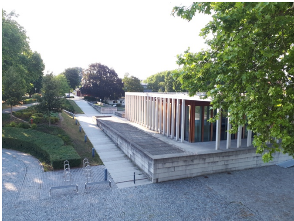
Das Literaturmuseum der Moderne

Auf dem gleichen Gelände befinden sich überdies zwei Museen, welche vom DLA betreut werden. So zeigen sowohl das Schiller-Nationalmuseum als auch das Literaturmuseum der Moderne Dauer- und Wechselausstellungen, welche von der Abteilung ‚Museen‘ beaufsichtigt werden.